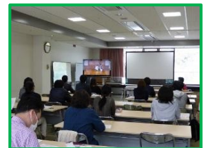
新規採用職員等向けの研修