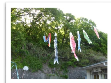
こいのぼりの下で